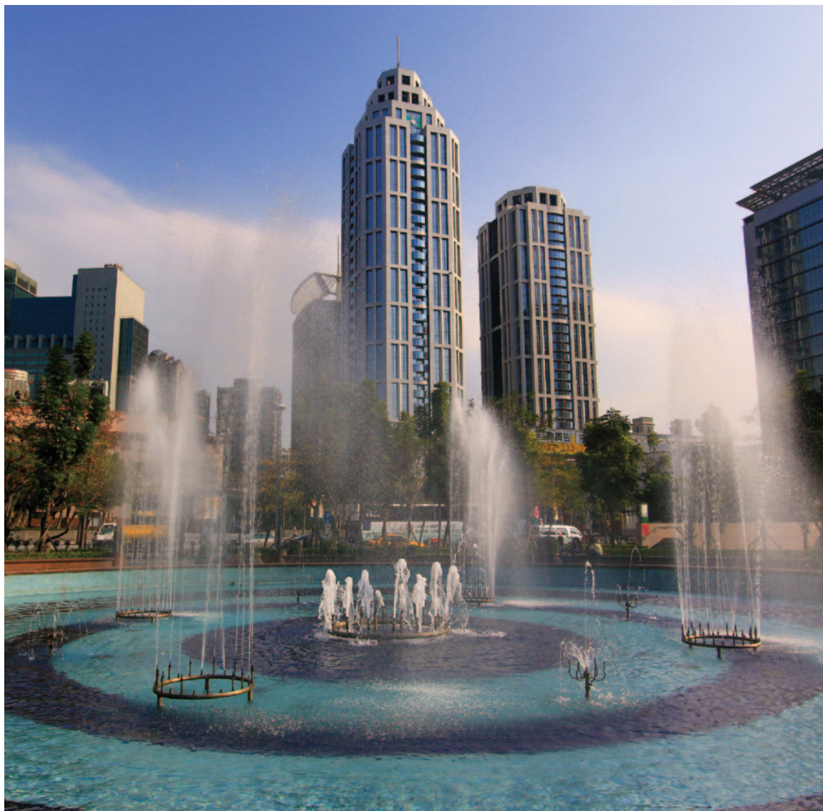
板信雙子星之美 | 徐簡麟

為提供客戶更優質的服務，本行企業總部已於100年進駐新板特區板信雙子星大樓，除了現有四鐵共構的便利交通，未來還有國際級歌劇院、五星級觀光飯店、大型休閒購物中心等重量級建設，可望直追台北市信義計劃區，成為北台灣與國際接軌的金融與商業重鎮。相信本行的遷入，不但可提升企業形象、凝聚全員共識，更可透過金融旗艦店的設立與組織效能的提升，滿足客戶提供最專業與優良的服務，並宣示本行邁向新紀元發展契機。今後，本行仍持續「誠信、務實、創新」的經營理念，提供完善金融服務，擴大營運規模，提升資產品質，創造最佳獲利，戮力成為具有專業利基的中型商業銀行。